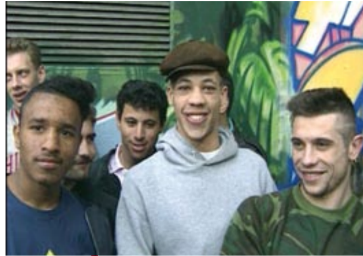
Les NTM à leurs débuts.

Le documentariste Hugues Demeude a pris le contre-pied de l'image du département habituellement véhiculée par les médias. Il s'est attaché à montrer les femmes et les hommes du territoire qui agissent.