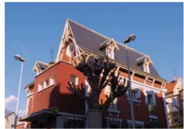
Le CMP, 4, rue Franklin.

M.L. CMP, centre médico-psychologique 4, rue Franklin. Tél. : 01 48 20 07 63. Ouvert du lundi au vendredi, de 9 h à 17 h.