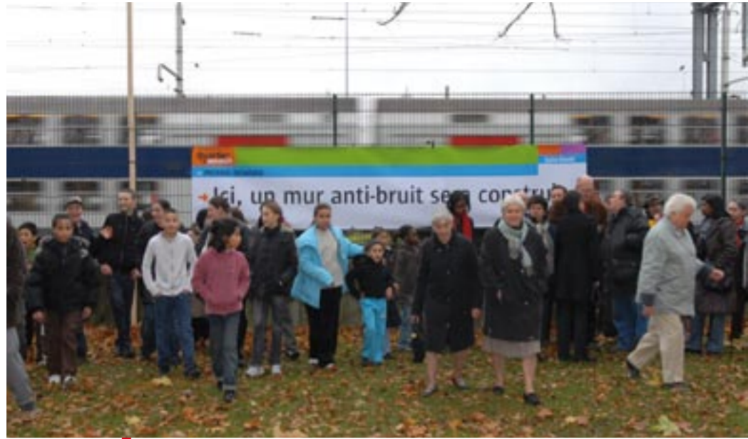
Samedi 15 novembre, quartier Pierre-Sémard, à l'emplacement du futur mur antibruit.

Le samedi 15 novembre, quelques dizaines d'habitants étaient présents au rendez-vous en bordure des voies ferrées pour fêter le démarrage des travaux, prévus mi-2010. Certains attendent ce mur depuis près de quarante ans.