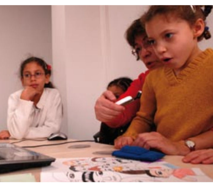
Séance de travail avec l'association Jeunes espoir de paix.

la maison de quartier Floréal et leurs partenaires: direction de la culture de la Ville, radio Déclic, collège La Courtille, centre de loisirs Pasteur, ludothèque la Saussaie, ALJT (Association logements jeunes travailleurs)... Plusieurs temps forts jaloneront cette se-