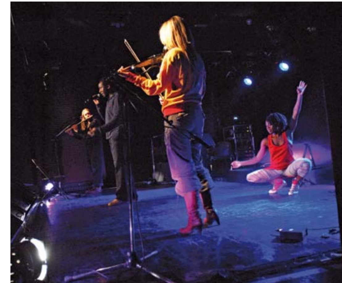
Répétition de Dionysia, le jardin des poètes , vendredi 17 octobre à la Ligne 13.

Dionysia, le jardin des poètes vendredi 21 et jeudi 27 novembre à 20 h 30 à la Ligne 13, 12, place de la Résistance-et-de-la-Déportation. Tél. : 01 55 87 27 10. Tarifs : 8 et 5 €.