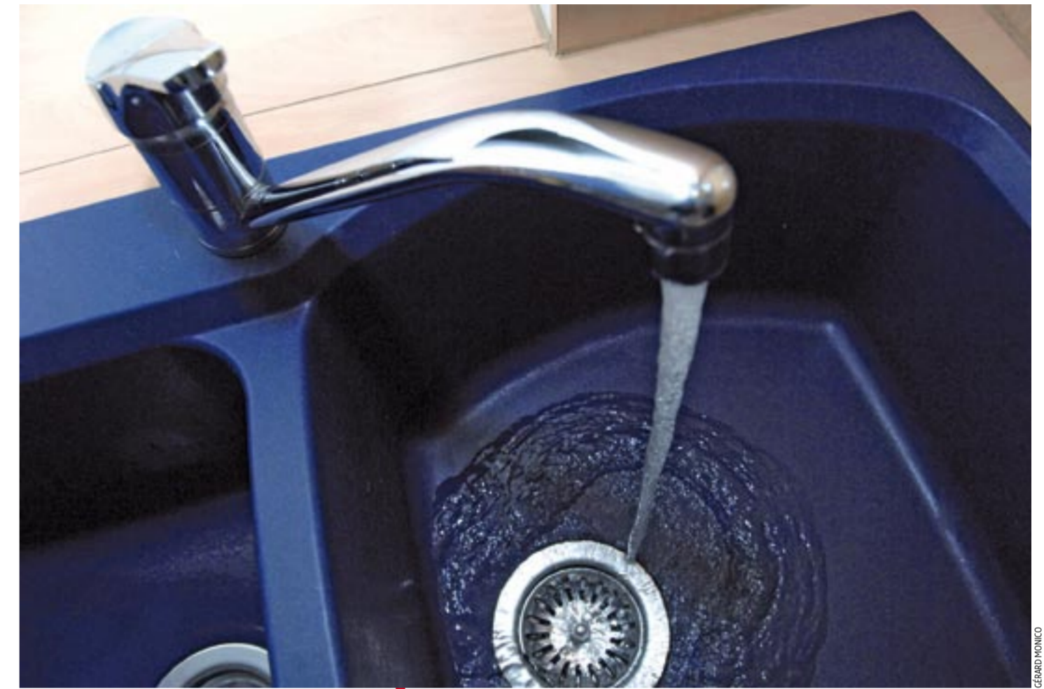
Veolia achemine l'eau jusqu'aux robinets de 4 millions de Franciliens.

Et c'est le moment ou jamais. Car le contrat qui lie le syndicat intercommunal à l'entreprise privée depuis 1923 (à l'époque Compagnie générale des eaux), arrive